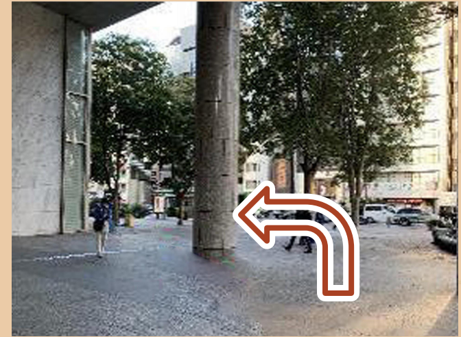
03/ 右轉後, 再左轉