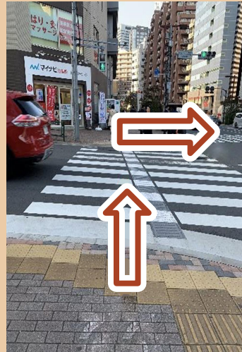
05/ 繼續直走後, 右轉, 過馬路後, 左轉