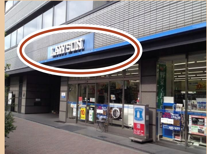
06/ 過馬路後即抵達會面點, 我們的夥伴會在這裡等候您的到來