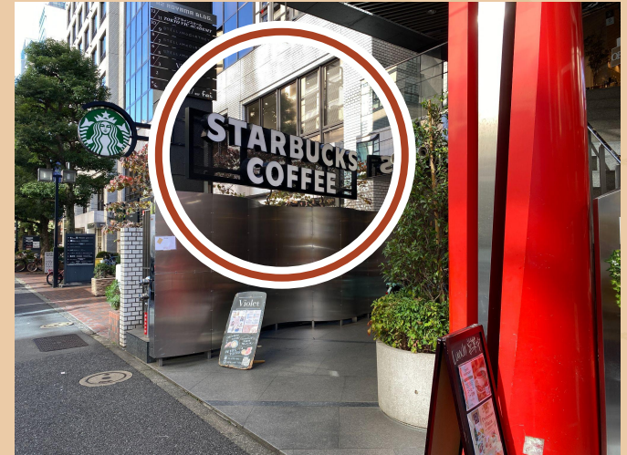
09/ STARBUCKS 을 보면, 저희 스태프가 기다리고 있을 것입니다.