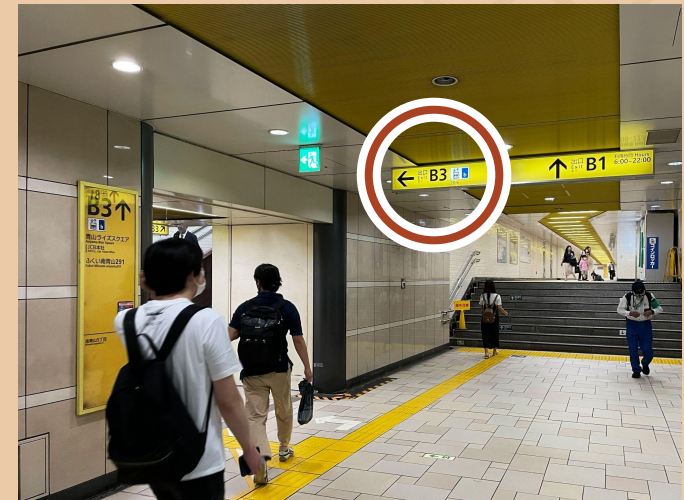
04 / B3출구 에스컬레이터를 탑승하세요