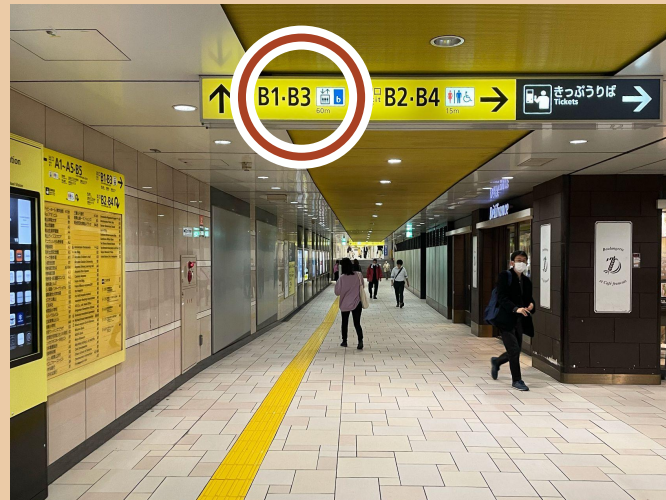
03/B3지표를 따라 계속 직진하세요