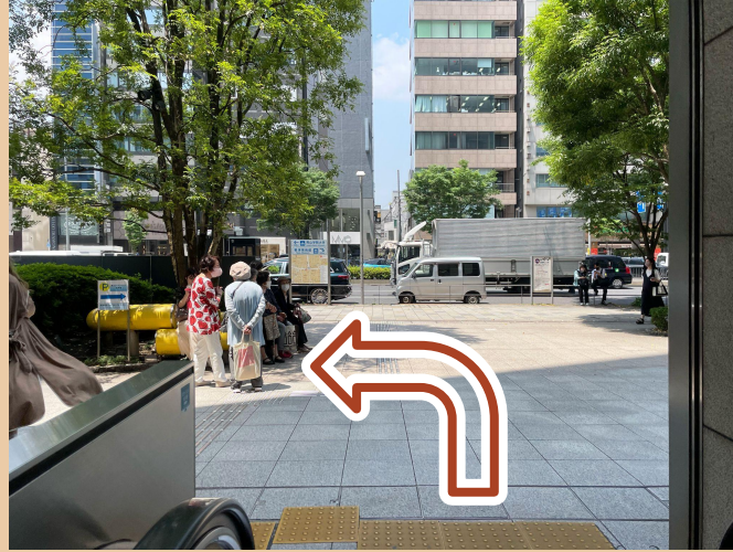
06/ 출구에 도착한 후 왼쪽으로 가세요.