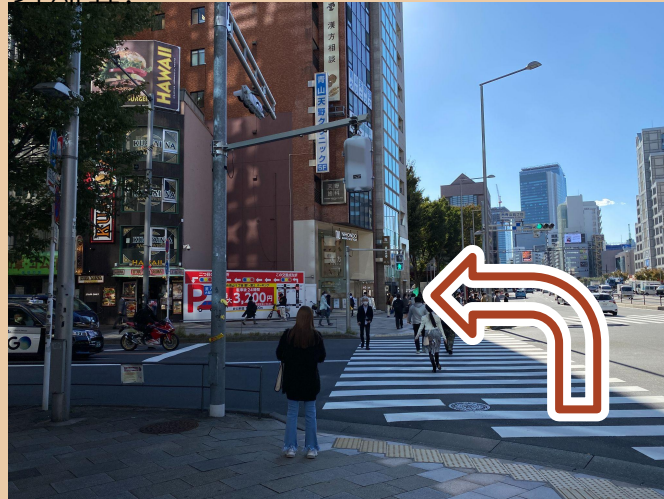
08/ 길을 건너 후 왼쪽으로 가세요