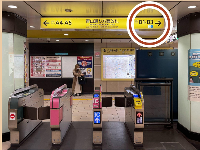
01 / B3출구로 가세요