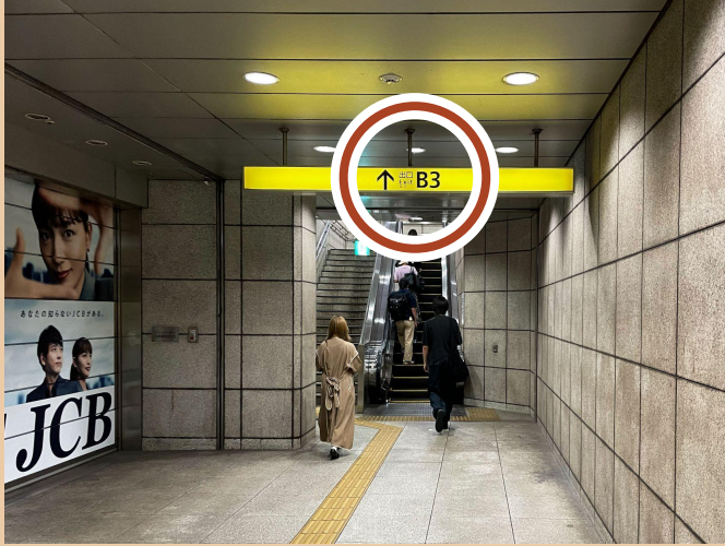
05/ 두 번째 에스컬레이터를 타고 출구로 가세요