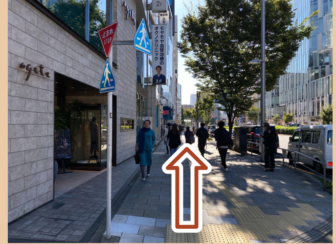
07/ 좌회전 후 계속 직진하세요