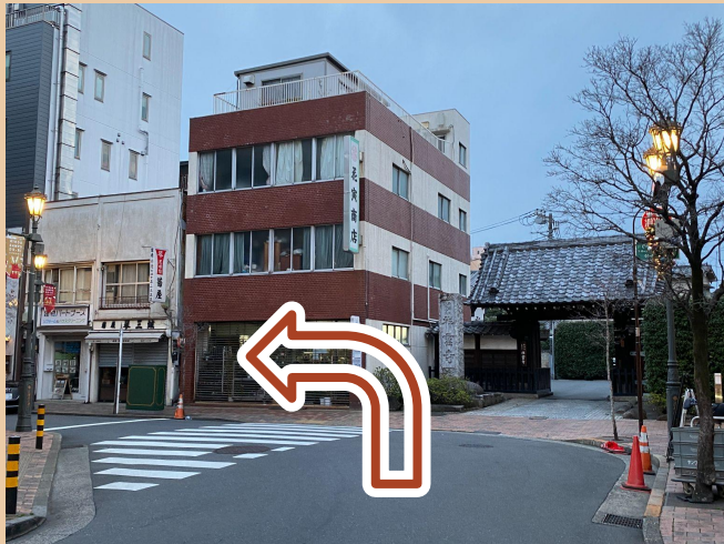
04/ 走到底後左轉, 一直直走