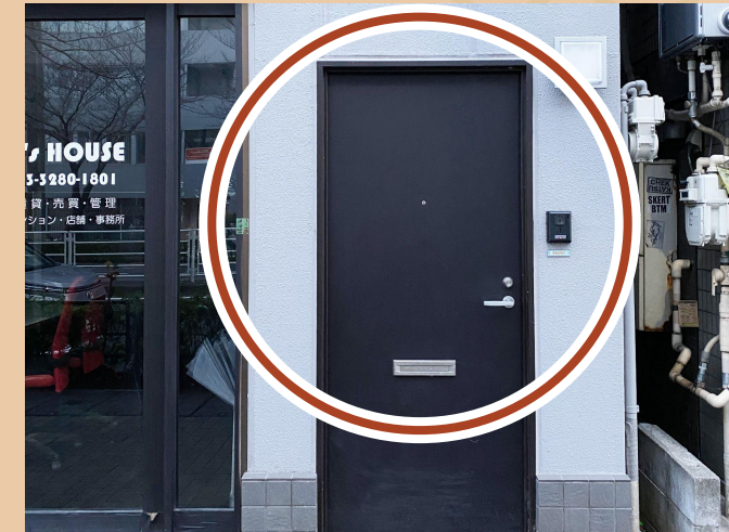
06/ 直走即抵達位於右手邊的會面點, 我們的夥伴會在這裡等候您的到來