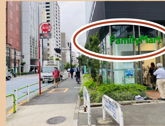
06/ 直走即抵達位於右手邊的會面點，我們的夥伴會在這裡等候您的到來