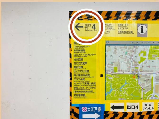
01/ 前往 4號出口