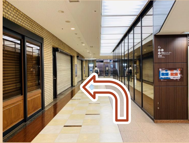
02/ 직진 후 좌회전하세요.