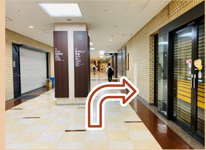
03/ 직진 후 우회전하세요.