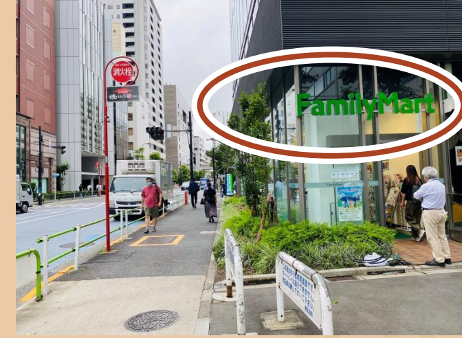
06/ 직진하시면 오른쪽에 있는 만남 장소에 도착합니다. 저희 스태프가 기다리고 있을 것입니다.