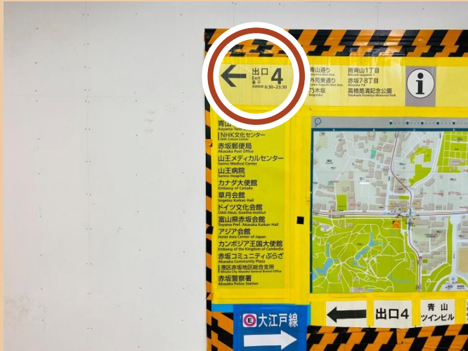
01/ 4번 출구로 가세요