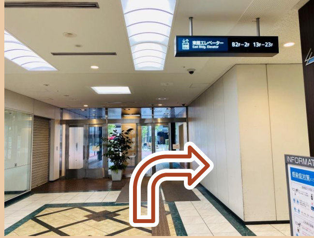
05/ 대문을 나선 후 우회전하세요.