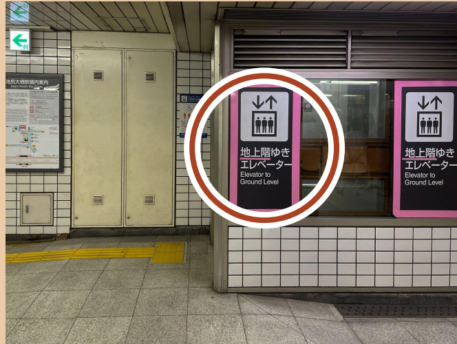
02/ 서쪽 출구에 있는 엘리베이터를 타세요.