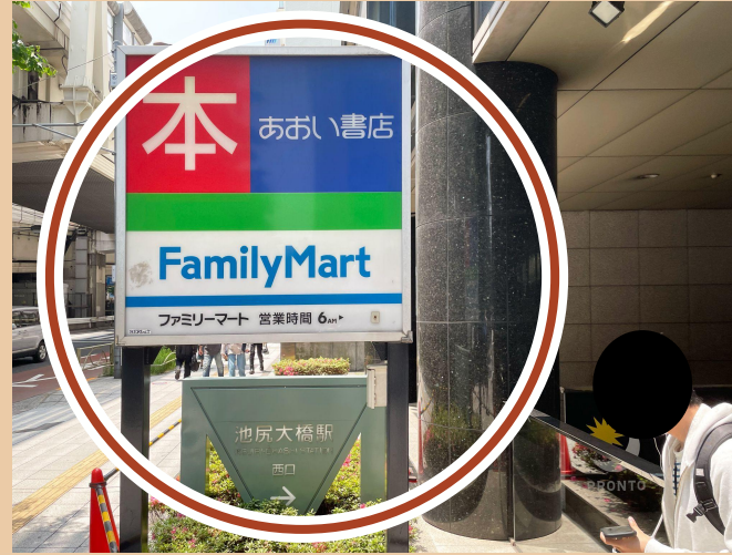
05/ 저희 스태프가 기다리고 있을 것입니다.