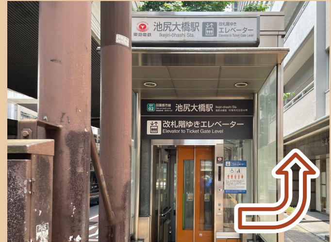
03/ 엘리베이터를 타고 역을 나온 후, 뒤로 가세요.