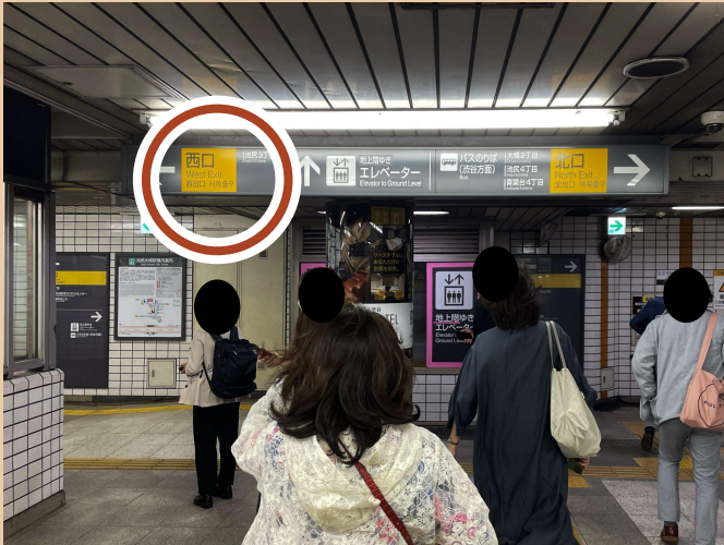
01/ 서쪽출구로 가세요