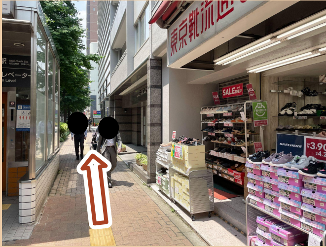
04/ 직진하시다 보면 Family Mart가 보이실 거예요.